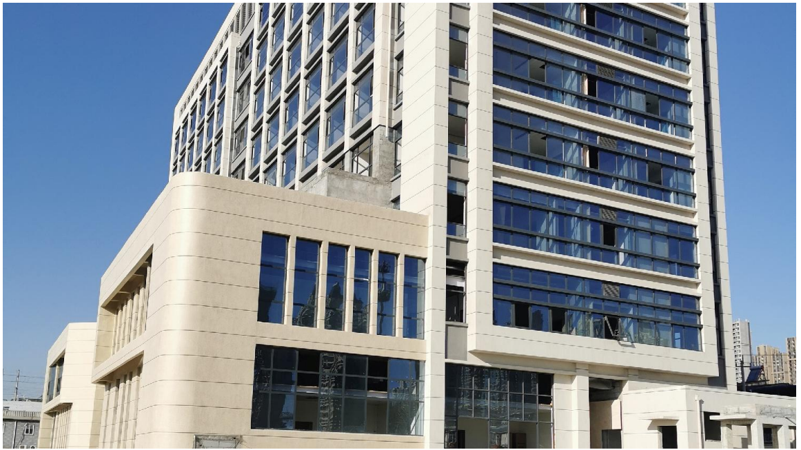
4 卫计综合服务楼封顶